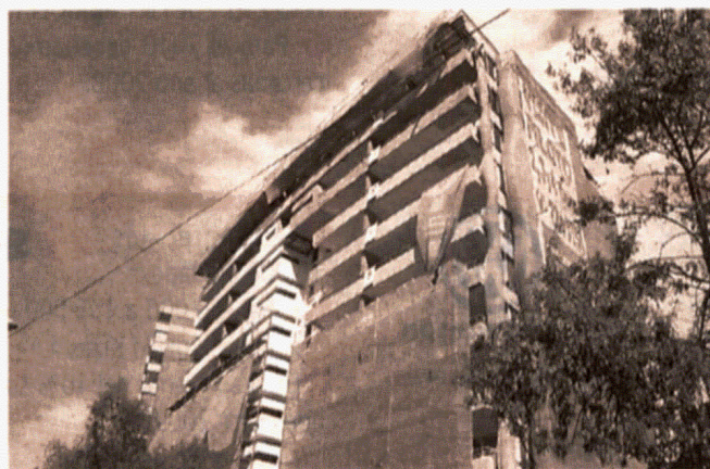
■ EN VENTA. La mayor cantidad de viviendas en venta corresponde a departamentos, con 720 proyectos.

A partir de ello, Aconcagua, "de acuerdo a nuestro concepto de estudio, tiene su mayor presencia de pro-